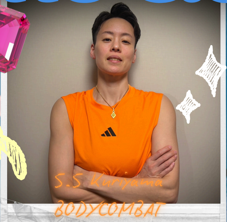
S.5 Kuriyama BODYCOMBAT