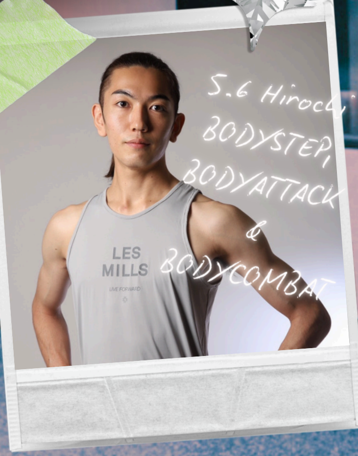
S.6 Hirochi BODYSTEP, BODYATTACK & BODYCOMBAT