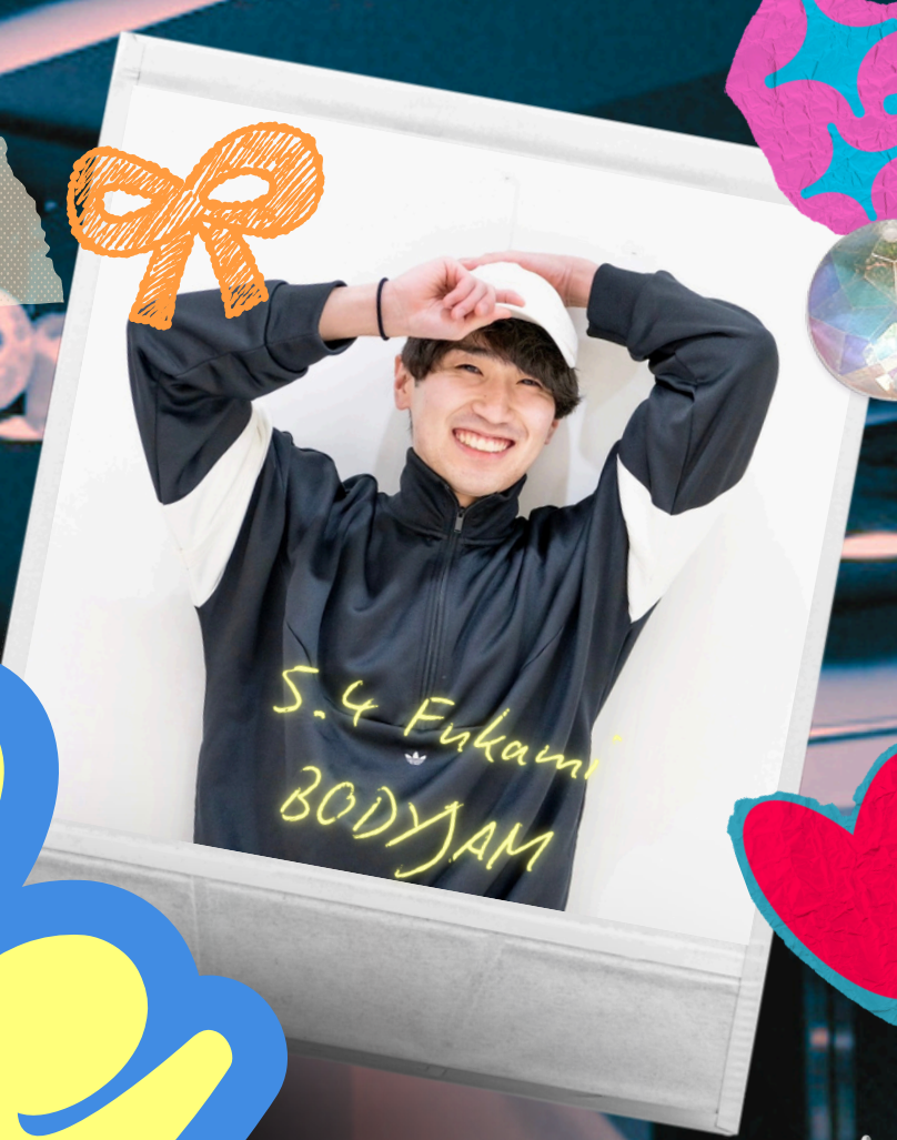
S.4 Fukami BODYJAM