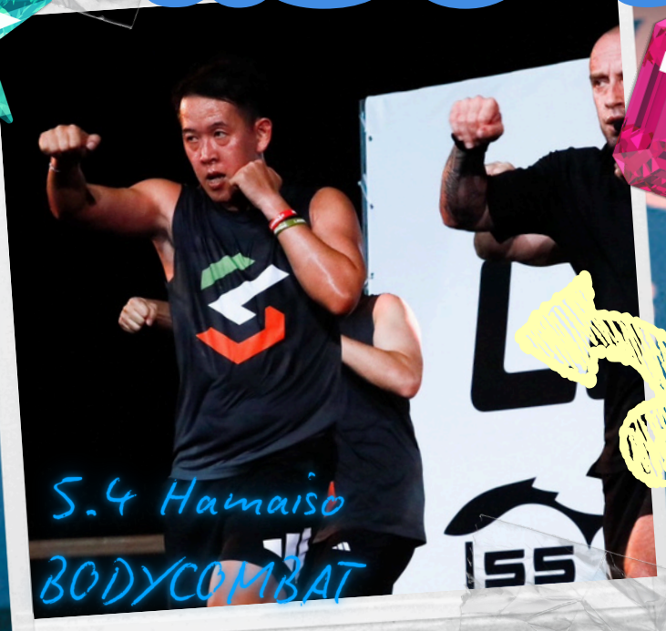
S.4 Hamaiso BODYCOMBAT